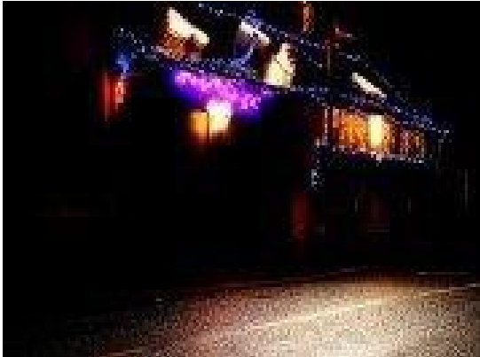
« Les illuminations »