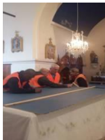
A la demande de la municipalité, l'Association du Vimeu a restauré le plafond de la chapelle de l'église.