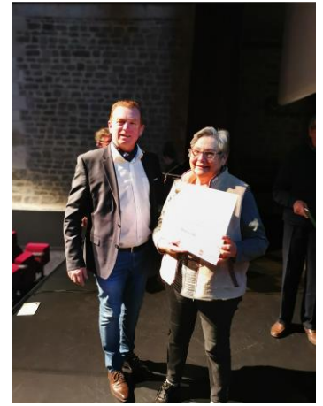
Remise du diplôme 1er Prix d'honneur villages fleuris 2019