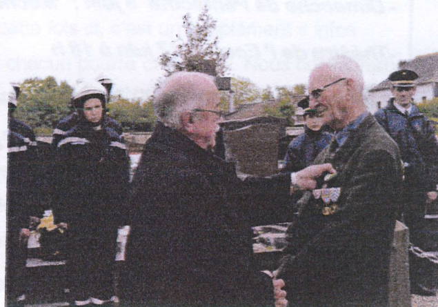
Discours du Maire pour l'anniversaire de la fin de la 2ème guerre mondiale